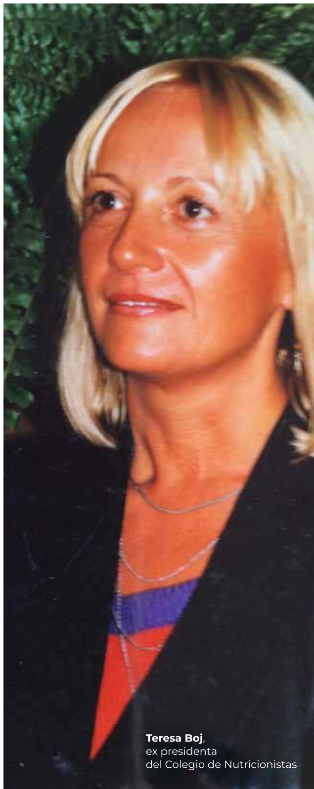
Teresa Boj , ex presidenta del Colegio de Nutricionistas