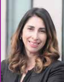
Cecilia Sepúlveda Presidenta Nacional